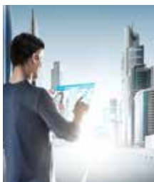
Titelbild: Vision 5G

VDI Landesverband Bayern VDI Bezirksverein München, Ober- und Niederbayern e.V. Westendstr. 199, D-80686 München Tel.: (0 89) 57 91 22 00, Fax: (0 89) 57 91 21 61 www.verein-der-ingenieure.de, E-Mail: bv-muenchen@vdi.de